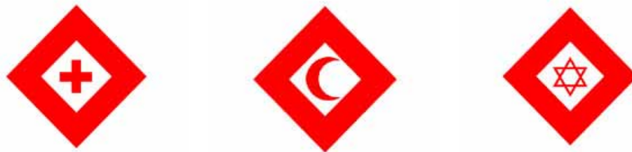
Jelvények kombinált alkalmazása a 3. cikk alapján

a III. Jegyzőkönyv elfogadását megelőzően. Nem lehet szó nélkül elmenni amellett, hogy a hivatalos magyar fordítás a „Vöröskereszt Nemzetközi Bizottsága” elnevezés helyett – valószínűleg tévedésből – „Nemzetközi Vöröskereszt Bizottsága” elnevezést szerepeltet. E szabály elsődleges címzettjének az izraeli nemzeti társaság, a Magen David Adom tünik, amely az új embléma elfogadásával 2006. június 22-én teljes jogú tagjává válhatott a Nemzetközi Vöröskereszt és Vörös Félhold Mozgalomnak. Az előírás megfelelő alkalmazásával lesz lehetséges majd az emblémák kombinált alkalmazása.